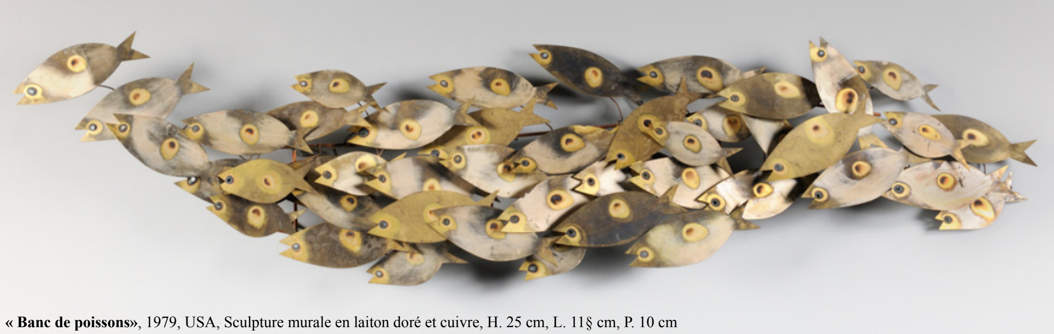
« Banc de poissons », 1979, USA, Sculpture murale en laiton doré et cuivre, H. 25 cm, L. 118 cm, P. 10 cm