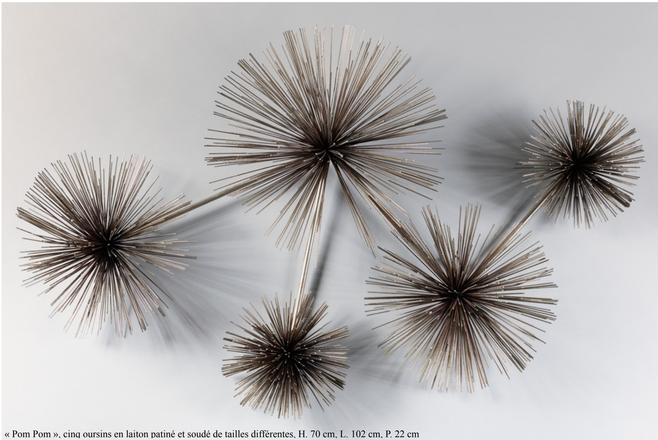
« Pom Pom », cinq oursins en laiton patiné et soudé de tailles différentes, H. 70 cm, L. 102 cm, P. 22 cm