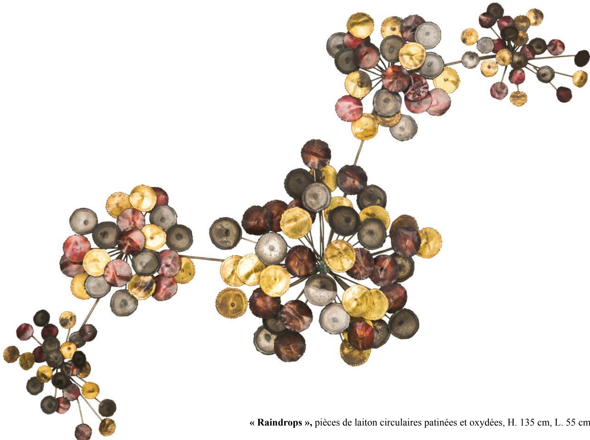
« Raindrops », pièces de laiton circulaires patinées et oxydées, H. 135 cm, L. 55 cm, P. 10