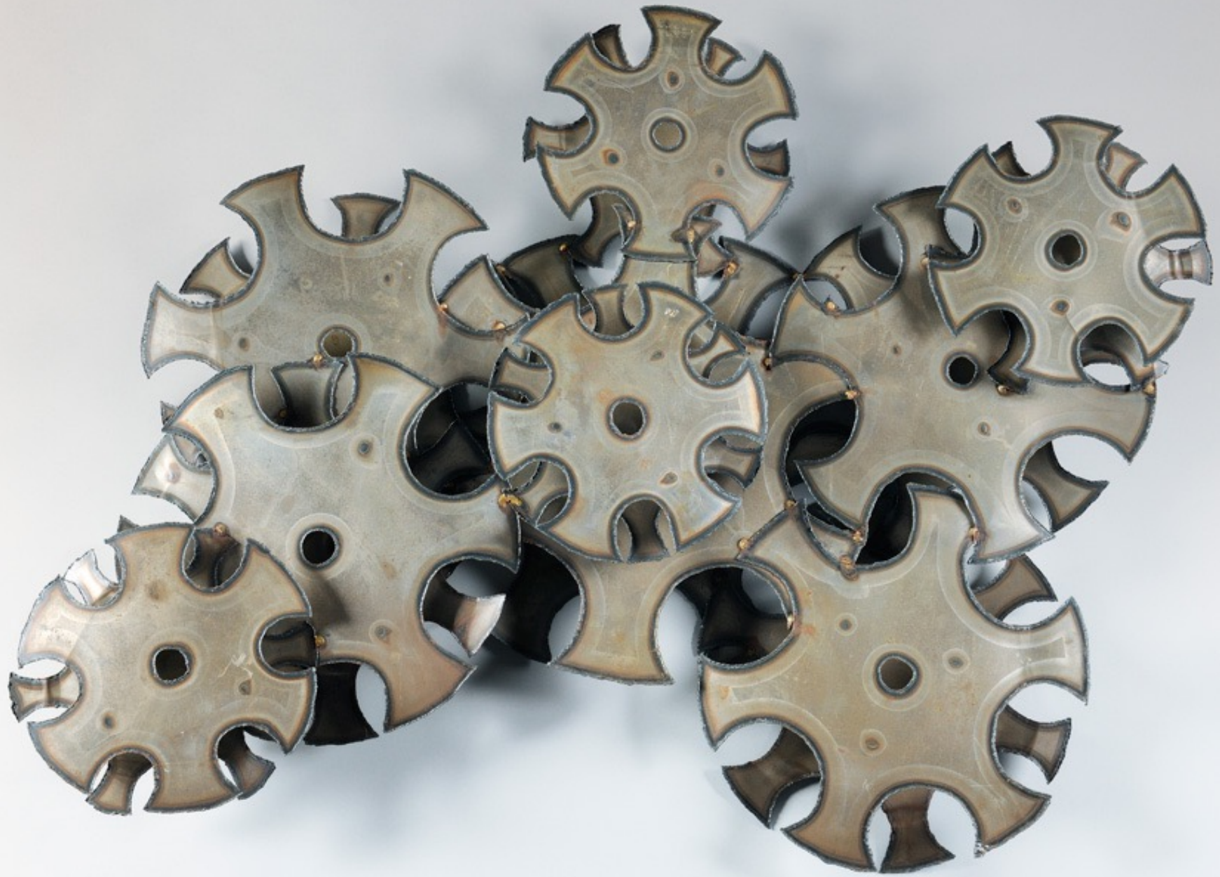
« Les temps modernes », Sculpture murale en laiton et métal