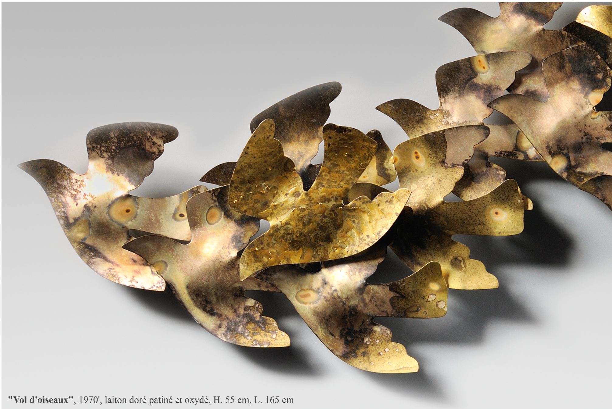
"Vol d'oiseaux", 1970', laitton doré patiné et oxydé, H. 55 cm, L. 165 cm