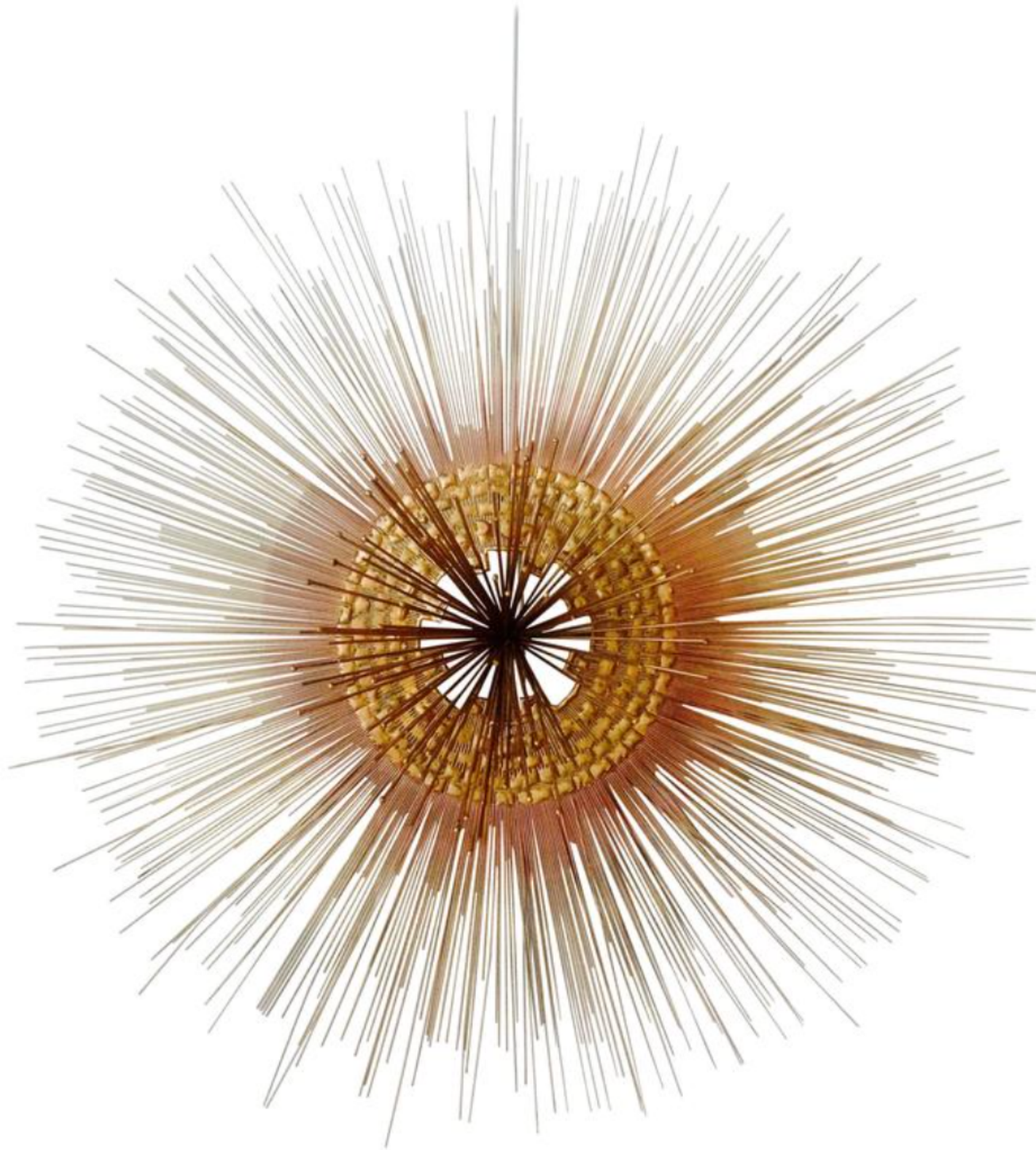
« Soleil », cuivre et laiton patiné, diamètre 77